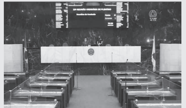
Em reunião virtual de Plenário, deputados trataram de vacinação e testagem de Covid-19 em Minas Gerais