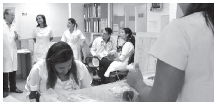
Os profissionais poderão atuar na rede pública e instituições privadas que atendam ao SUS

A lei é originária do Projeto de Lei 2.591/21, do presidente da Casa, Agostinho Patrus (PV), e prevê a convocação de voluntários e a contratação de estudantes e aposentados para o enfrentamento da pandemia. Também permite a contratação de serviços de saúde por meio de credenciamento de pessoa física ou jurídica e de médicos estrangeiros que morem no Brasil e que tenham exercido a medicina no País conforme a Lei Federal 12.871, de 2013. Na contratação dos estagiários será dada preferência para aqueles que estejam