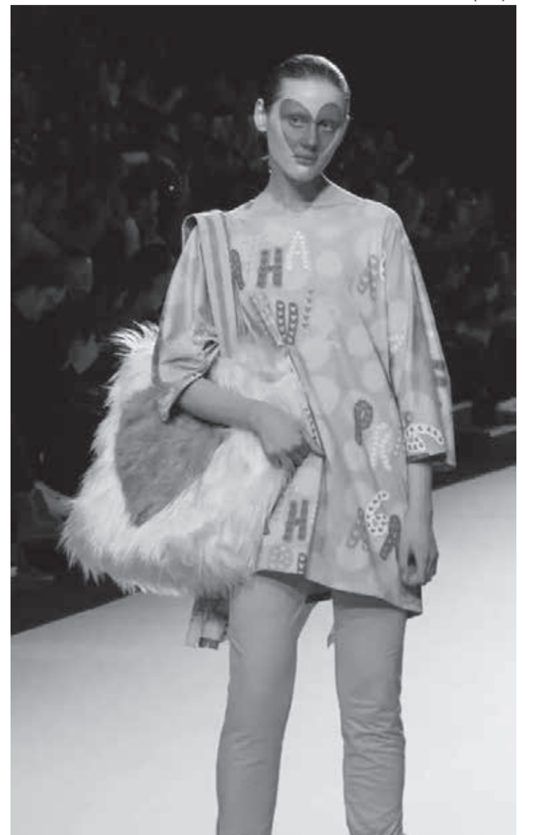
Desfile da Madri Fashion Week

• Uma das mais dinâmicas mineiras, Skazi traz inovações em plena onda pandêmica com criativas ferramentas de aproximação com