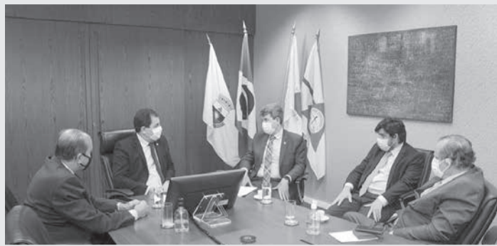
Programa Destrava Minas, de iniciativa do TJMG, reúne diversas instituições em busca de soluções consensuais

O Destrava Minas, que visa solucionar, de forma pacífica, a partir de diálogo entre as partes, conflitos judiciais envolvendo obras públicas paralisadas, conta com comitê interinstitucional formado por representantes do Tribunal de Justiça de Minas Gerais, Governo do Estado, Tribunal de Contas, Advocacia-Geral do Estado, Procuradoria-Geral de Justiça do Ministério Público de Minas Gerais e Defensoria Pública do Estado de Minas Gerais.