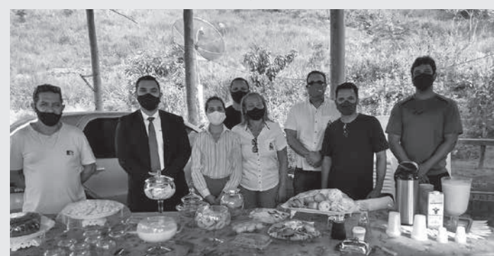
Diretoria e servidores da APAC no dia da posse