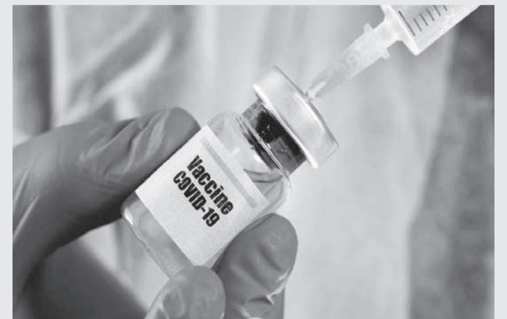
Prefeito de Ipanema e esposa teriam sido imunizados contra o novo coronavírus sem observação dos critérios de prioridade estabelecidos pelo governo (Crédito: Foto Ilustrativa)

Público, a conduta do casal violou claramente o princípio da moralidade administrativa, "pois demonstrou a ausência do respeito mínimo pelo interesse público e pela população ipanemense, afrontando também o princípio da impessoalidade, já que os requeridos desprezaram os critérios técnicos previamente definidos, em nítido interesse pessoal". Diante disso, o MP requereu, como medida de urgência, a indisponibilidade de bens, direitos e valores pertencentes ao casal.