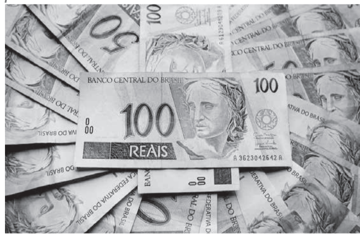
O casal recebeu aproximadamente R$ 209 mil, em 2014, para quitar dívida de cheque especial