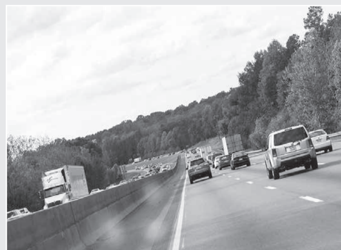
O acidente de ônibus aconteceu na rodovia ligando BH a João Monlevade e causou na passageira traumatismos craniano e na coluna, além de sequela psicológica