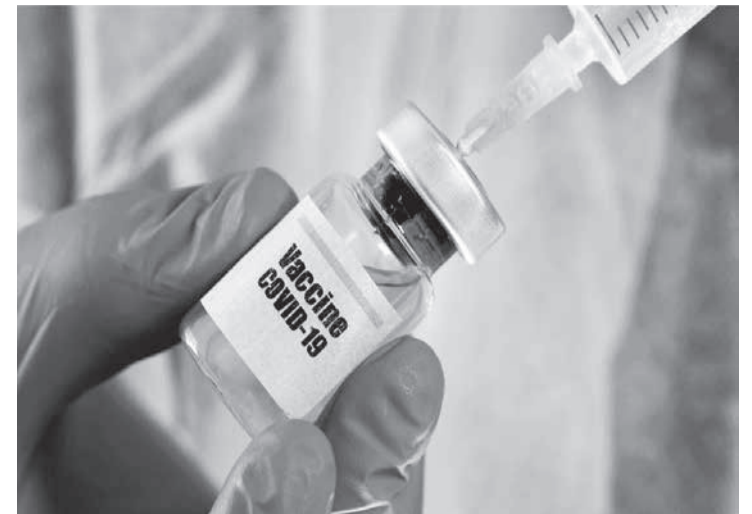
Notícia - João Monlevade)

Programa contempla a região - As cidades de São Gonçalo do Rio Abaixo, Barão de Cocais, Rio Piracicaba e Caeté são contempladas pelo programa Criando Caminhos, da Vale, que busca a melhoria da infraestrutura de estradas vicinais. A iniciativa utiliza um pavimento desenvolvido com areia da empresa, proveniente do processo de tratamento do rejeito de minério de ferro. Conforme anunciado, haverá a pavimentação de 20 quilômetros de estradas de terra, com trechos de cinco quilômetros em comunidades rurais de cada município, utilizando aproximadamente 40 mil toneladas de areia, oriundas do tratamento do rejeito da Mina Brucutu, em São Gonçalo do Rio Abaixo. (Jornal A