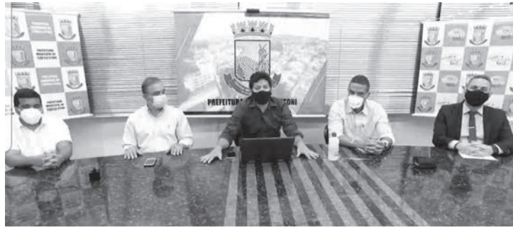
Anúncio da reabertura do comércio em Teófilo Otoni a partir desta segunda-feira (26/04/21)

terminadas no caput passam a valer a partir desta segunda-feira, 26 de abril de 2021 e irão vigorar enquanto não for publicada uma nova avaliação do programa estadual Minas Consciente. O Art. 2º ressalta que, a autorização conferida no artigo anterior não dispensa, sob qualquer hipótese, o cumprimento dos protocolos sanitários respectivos de acordo com o enquadramento da atividade em cada onda.