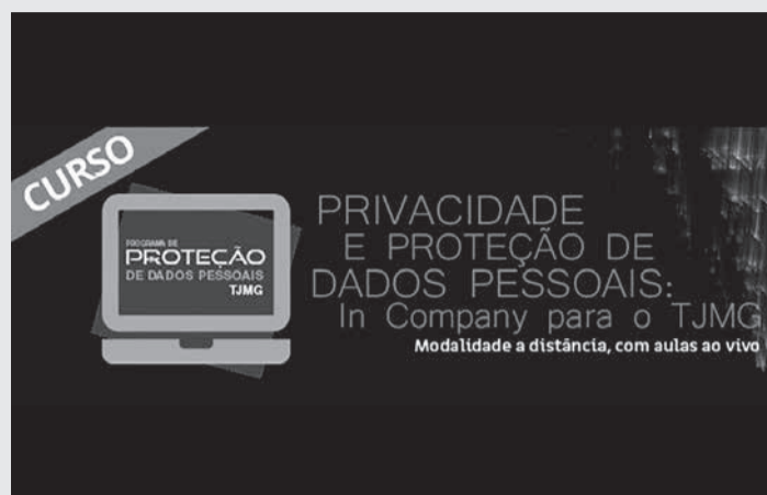
Curso vai preparar equipes do TJMG para compreender em profundidade a LGPD