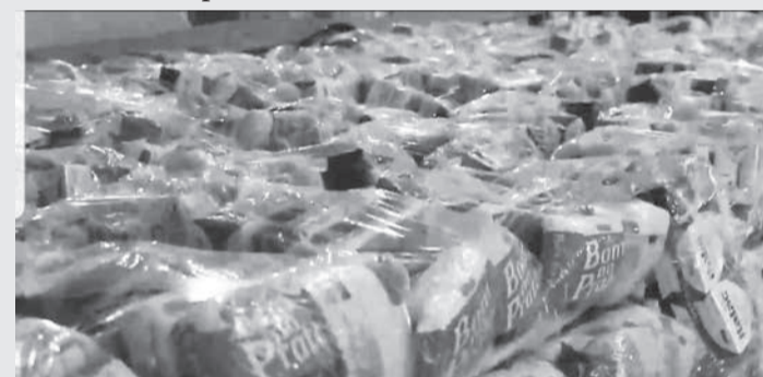
Quase 11 mil alunos recebem o kit de merenda escolar