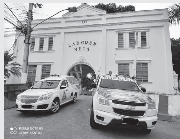
O corpo do bebê foi necropsiado no IML de Teófilo Otoni