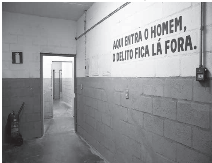
A primeira Associação de Proteção aos Condenados (Apac) Juvenil do mundo começou a funcionar a partir de quinta-feira (13/05), na cidade de Frutal, Triângulo Mineiro

Também foi inaugurada a Apac de Conceição das Alagoas