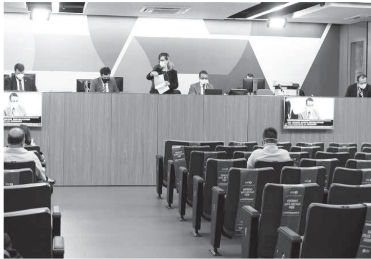
Comissão de Constituição e Justiça analisou projetos na manhã desta terça (18)