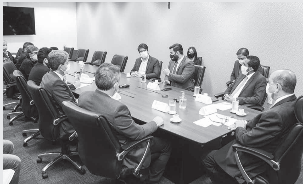
Desembargador José Arthur Filho intermediou o início do acordo entre prefeitos e Governo Estadual

Reunião para tentar conciliação foi realizada no Tribunal de Justiça de Minas Gerais