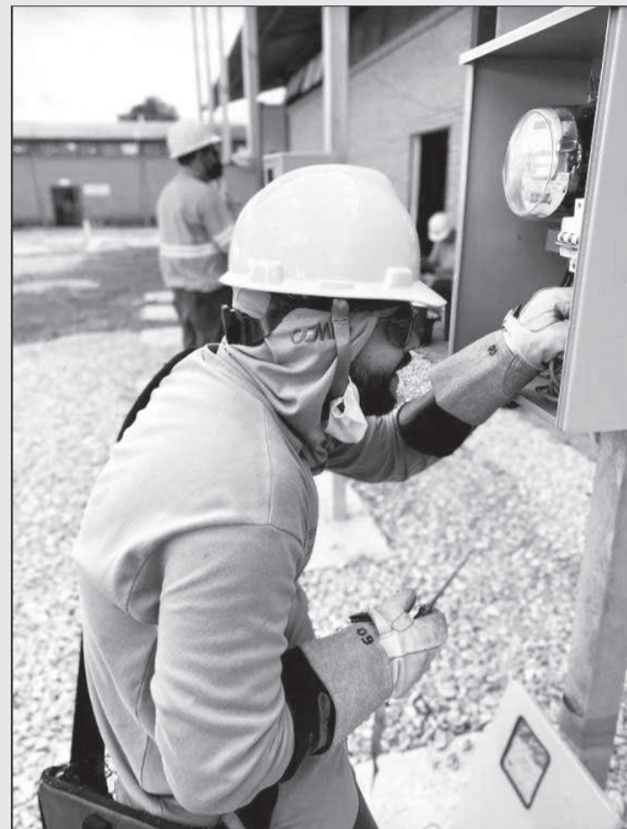
SENAI aplica treinamento com material e direcionamento didático fornecidos pela Cemig

As aulas serão ministradas pelo SENAI, sendo que toda a parte didática e de equipamentos - como a matriz de treinamento e os materiais disponibilizados para prática dos alunos, como uniformes, EPI's, EPC's, cabos, peças etc.