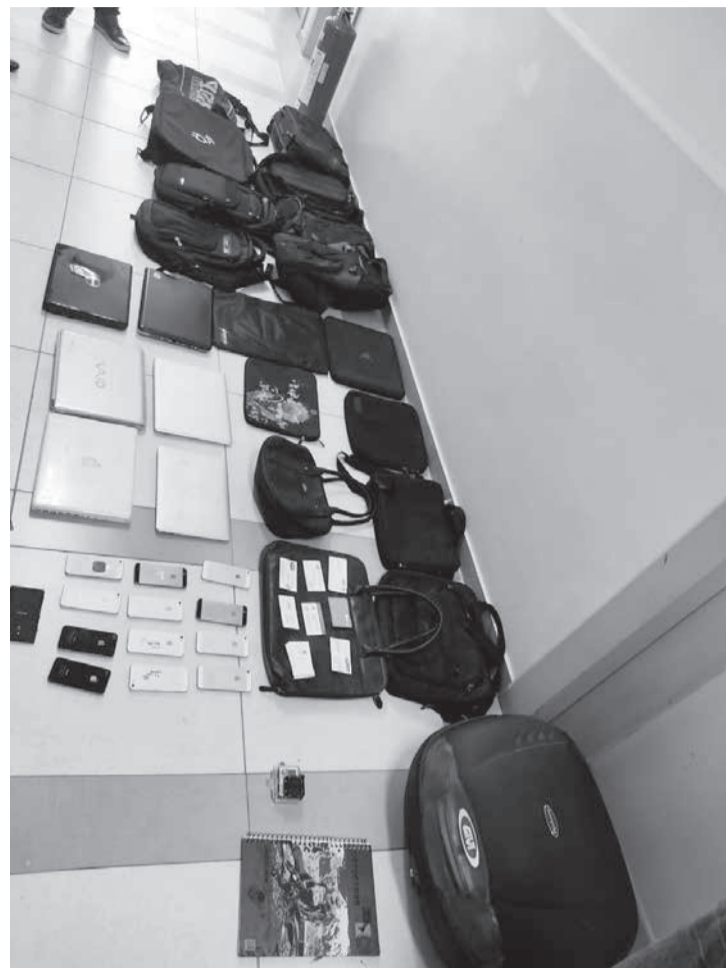
Materiais apreendidos pela PCMG em Teófilo Otoni na casa e loja da empresária G.A.P. de 36 anos

De acordo com a Polícia Civil, após as diligências “foram apreendidos diversos produtos de origem duvidosa, que serão objetos de investigação, tanto nessa