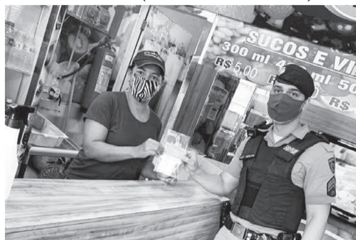
Polícia Militar fez a entrega de máscaras de proteção e de folders com a lista das instituições que compõem a rede de enfrentamento à violência doméstica