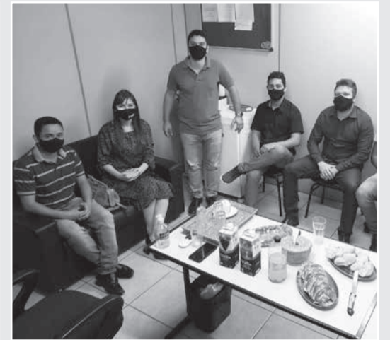
Reunião com vereadores de Teófilo Otoni