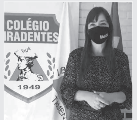
Visita ao Colégio Tiradentes da PMMG em TO