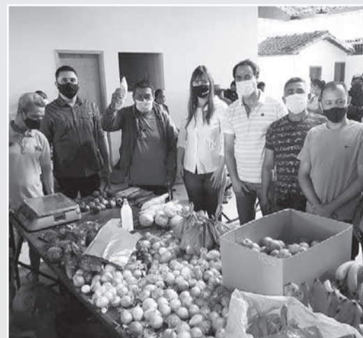
Visita ao mercado de Ladainha