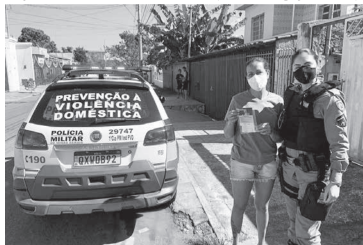
Kits foram entregues durante os atendimentos realizados pelas equipes especializadas no combate à violência contra a mulher