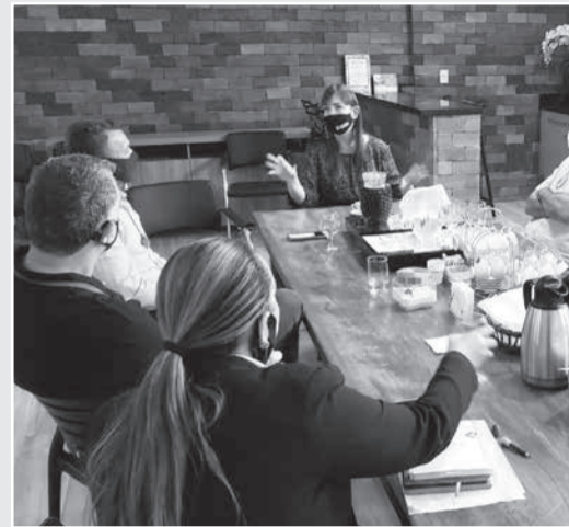
Reunião na CDL-TO