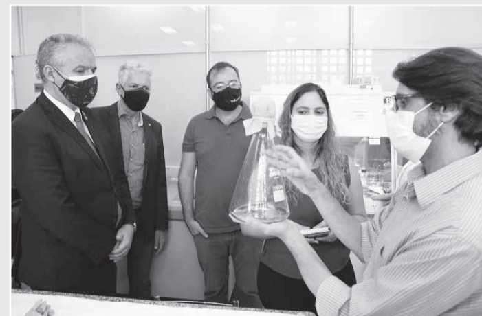
Deputados visitaram os laboratórios onde está em fase de desenvolvimento a vacina SpiNTec

Pesquisador defende soberania nacional na produção de vacina - No entanto, ainda há várias etapas até a produção industrial da vacina. “Agora estamos buscando recursos para produzir o lote piloto de vacinas e fazermos os testes de segurança, para depois submetermos a vacina à Anvisa e, em dezembro deste ano, se tudo der certo, iniciaremos a Fase 1, de testes