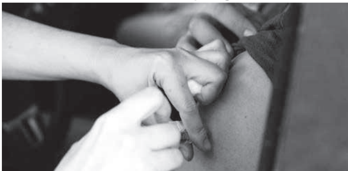
Deputados que pediram a reunião consideram que a vacinação do grupo tem demorado

Grupo foi incluído como prioritário pelo governo federal em abril, mas imunização segue lenta