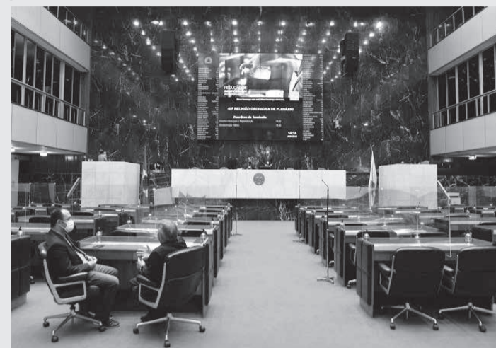
Assembleia recebeu projetos de crédito suplementar e criou três comissões extraordinárias

Para financiar tais despesas, serão utilizados recursos da anulação de dotações orçamentárias do grupo de Pessoal e Encargos Sociais, da fonte de Recursos Ordinários, até o valor de R$ 40 milhões; da anulação de dotação orçamentária do grupo de Outras Despesas Correntes, da fonte de Recursos Ordinários, até o valor de R$ 10 milhões; da