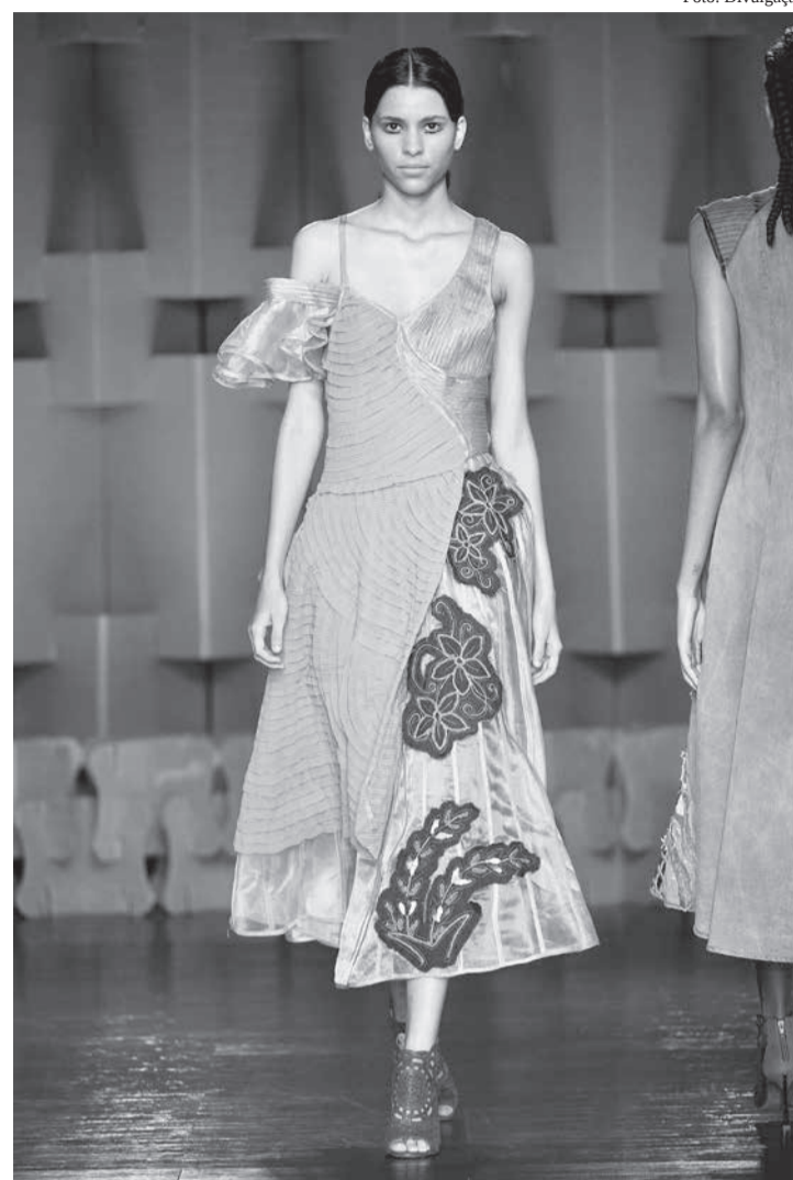
Criação de Ronaldo Silvestre

• O processo de compras no circuito das grandes empresas de moda continua em curso. A