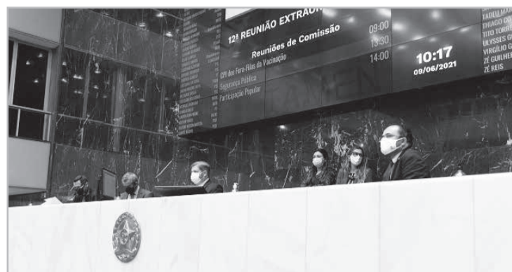
O estado de calamidade pública foi reconhecido para 26 municípios e prorrogado para outros 60

A medida flexibiliza o disposto na Lei de Responsabilidade Fiscal. Dessa forma, enquanto perdurar a