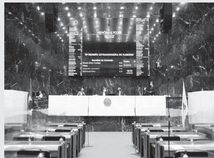
Em Reunião Extraordinária, Plenário acatou importantes projetos em favor da agropecuária

A matéria altera a Lei 10.021, de 1989, que estabelece as normas para a vacinação obrigatória contra essas doenças nos herbívoros do Estado, e foi aprovada em sua forma original. A transformação da multa em advertência contempla, por exemplo, casos em que o produtor vacinou o rebanho, mas teve dificuldades em comprovar a vacinação, por causa das alterações em procedimentos de fiscalização durante a