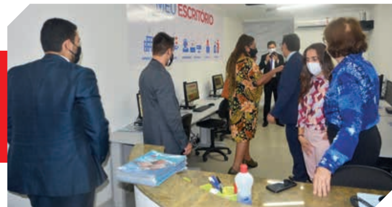
A sala está localizada ao lado da sede da 28ª Subseção da OAB