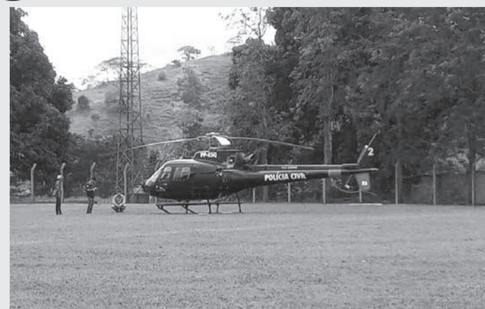
O Delegado da Polícia Civil foi conduzido preso para Belo Horizonte neste mesmo dia (22/06/21)

A PC informou também que, durante o cumprimento do mandado de busca e apreensão, houve ainda a prisão em flagrante do delegado de polícia, pelo crime de armazenar irregularmente combustível e porte ilegal de arma de fogo e munições. Investiga-se ainda a prática do crime de peculato praticado pelo servidor público, em virtude da posse indevida de quantidade considerável de combustível que seria desti-