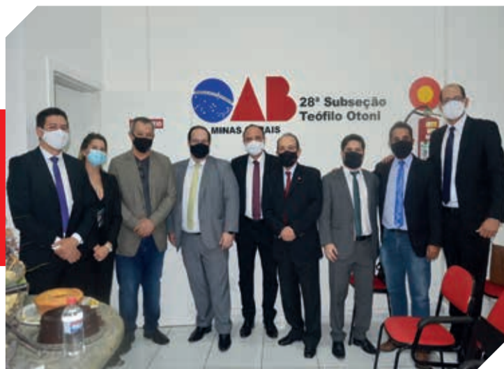
Autoridades prestigiaram o evento na 28ª Subseção da OAB