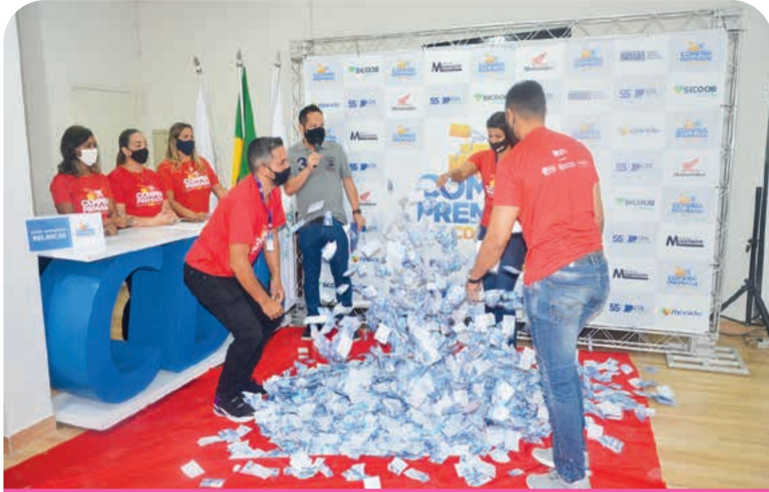
Sorteio foi realizado, na sexta-feira (18/06), na sede da CDL-TO