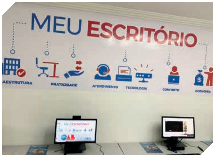
Meu Escritório – Centro de Excelência Jurídica