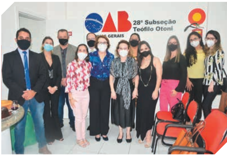
Advogadas e Advogados da 28ª Subseção OAB recebendo convidados