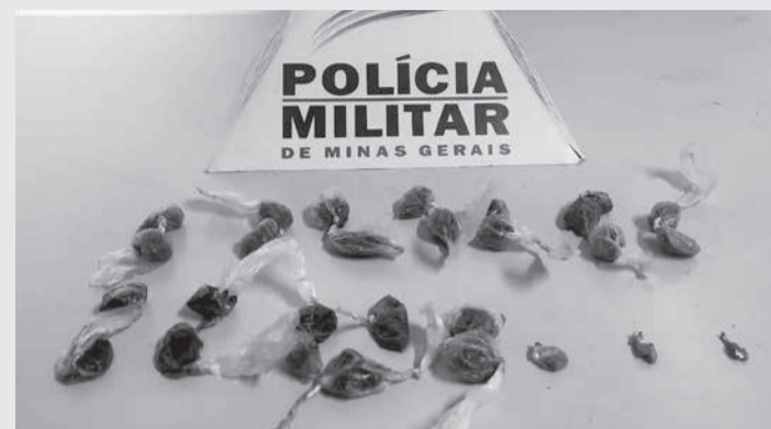
A PM apreendeu drogas durante as diligências

Os militares continuaram em atendimento à ocorrência do crime de Maria da Penha, encaminharam a vítima ao hospital municipal para