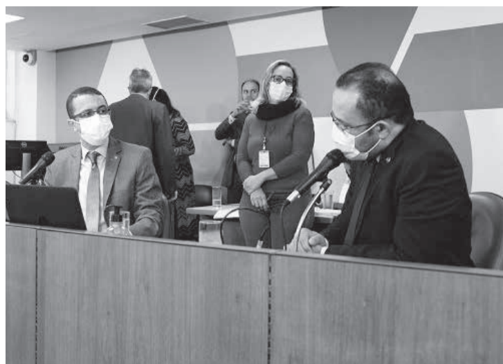
PEC, analisada pela Comissão de Constituição e Justiça, seguirá para apreciação de comissão especial