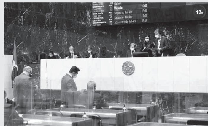
Projeto que inclui os agricultores familiares e programas aprovados pelo Cedraf como beneficiários de suporte financeiro foi votado

Entre as instituições que podem ser financiadas pelo fundo, o projeto inclui as associações e cooperativas de produtores rurais ou agricultores familiares que participem de programas aprovados pelo Conselho Estadual de