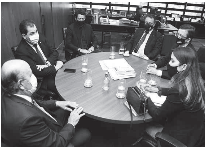
TJMG vai avaliar a possibilidade de destinar imóveis do Judiciário para instalação de delegacias da Polícia Civil de Minas Gerais