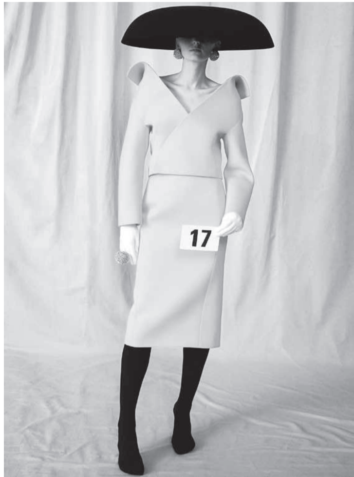
Balenciaga: resgate da alta-costura

Esse caminho é exatamente o contrário ao da fast-fashion (modinha rápida), cujo consumo parece condenado na pós-pandemia, e que re-