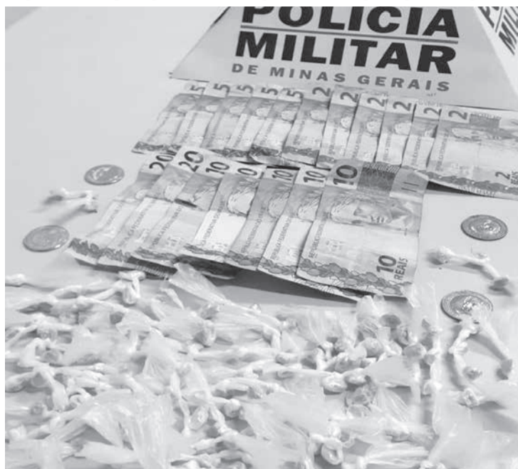
foram encaminhados à delegacia de Polícia Civil. Equipe GEPAR: sargento Mikael, cabos Abrantes e Wallace, soldado Ribeiro. (Informações/Foto: PMMG/19º BPM).

Após levantamentos, a equipe confirmou a veracidade das denúncias, fez buscas na casa e localizaram 182 pedras de crack e R$ 131,00 em dinheiro. Mãe e filho foram presos por tráfico de drogas, e junto com os materiais