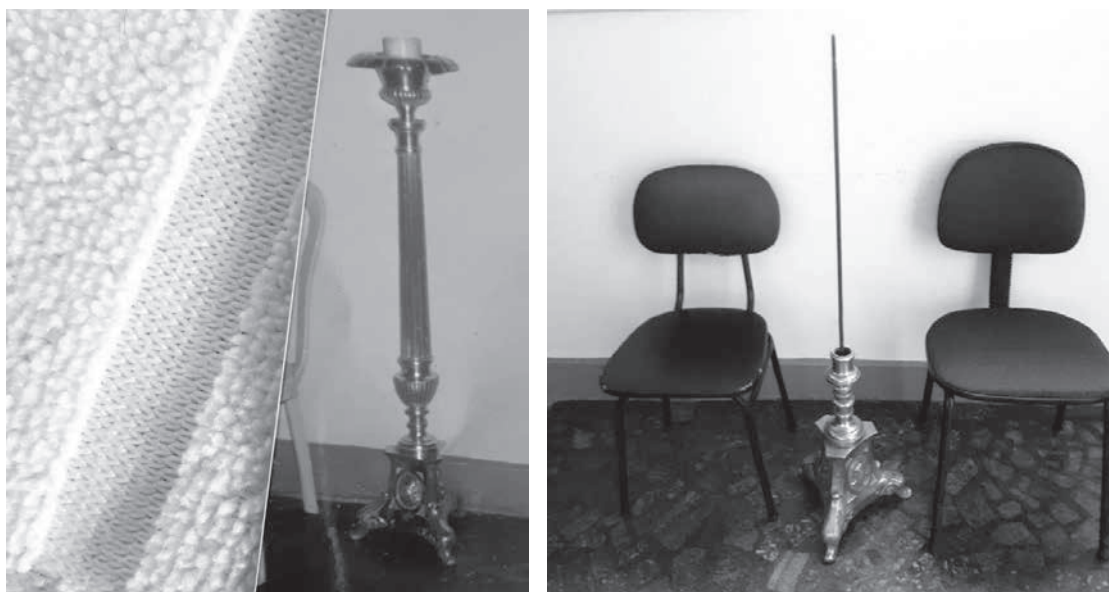
Antes do furto