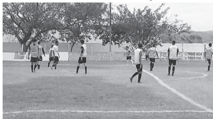
A seletiva no campo do Concórdia