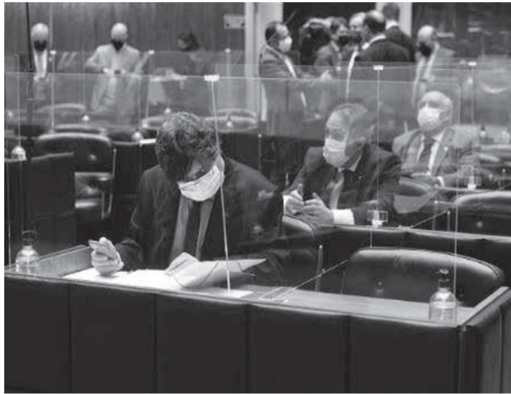
Projetos que deram origem às normas sancionadas foram aprovados na ALMG em 6 de julho

De acordo com a proposição, empregadores condenados conclusivamente por reduzir alguém à condição análoga à de escravo ficam impedidos de celebrar contrato com o Estado. A proibição aplica-se até o integral cumprimento da pena. Contratos feitos em data anterior à publicação da norma continuam a valer, mas não poderão ser prorrogados caso haja condenação posterior à publicação.