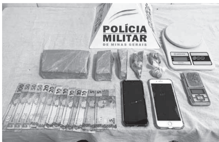
trados 06 tabletes de maco-nha, 02 balanças de preci-são, R$350 em dinheiro e dois aparelhos celulares de procedência duvidosa. Ele foi conduzido à delegacia de Polícia Civil junto com os materiais apreendidos para as medidas de polícia judiciária. (Assessoria de comunicação organizacional do 44º BPM, Almenara).

Segundo a PM, o homem disse que tinha drogas em sua residência, também na área central, onde foram feitas diligências e encon-