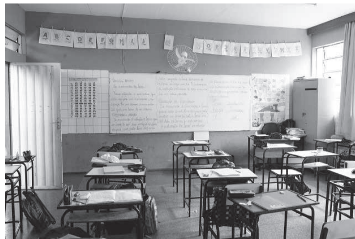
Proposição de lei veta parcerias na educação como o projeto Somar, que prevê a gestão escolar compartilhada com a iniciativa privada

O chefe do Executivo lembra que o fortalecimento das parcerias entre o Governo do Estado e a iniciativa privada remonta ao ano de 2004, com as diretrizes para cooperação com as Associações de Proteção e Assistência aos Condenados (Apacs) na administração de centros de recuperação de presos – uma experiência bem-sucedida que ele acredita que pode ser igualmente reproduzida na saúde e na educação. “Em suma, a