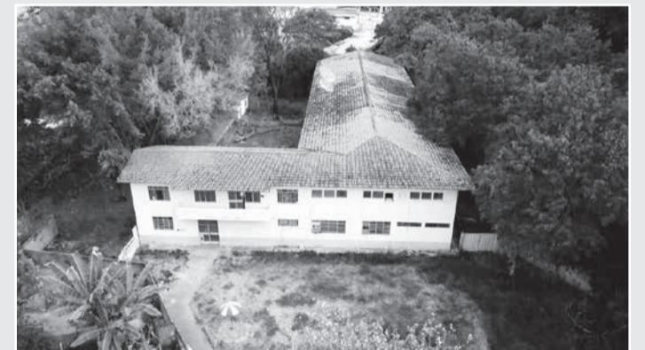
Prédio da antiga Superintendência de Ensino vai funcionar a Escola Municipal Irmã Maria Amália

já foi encaminhado para a Câmara Municipal, e afirma ter certeza que será apreciado, votado e aprovado pelos vereadores.