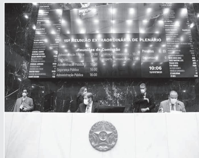
Leis sancionadas foram aprovadas em Plenário no mês de julho

Previdência - Já a Lei Complementar 158 altera dispositivos da Lei Complementar 132, de 2014, que instituiu o Regime de Previdência Complementar para os servidores públicos do Estado. A redação