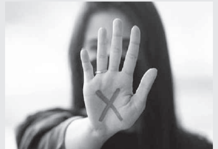
Vítimas de violência doméstica podem apresentar um sinal vermelho na mão para alertar que estão vivendo uma situação de vulnerabilidade