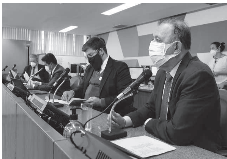
O pagamento de férias-prêmio a servidores foi debatido por parlamentares nesta terça-feira (17)