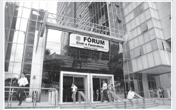
TJMG manteve decisão da 23ª Vara Cível de Belo Horizonte