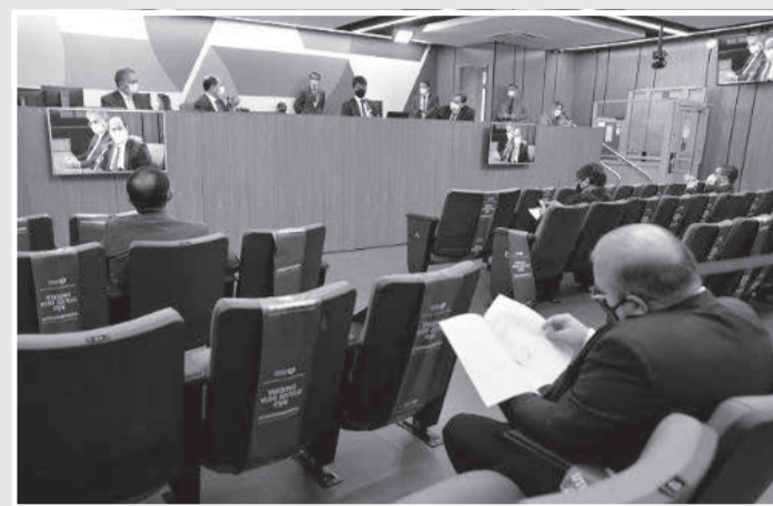
Depoimentos de funcionários da Cemig foram iniciados nesta semana