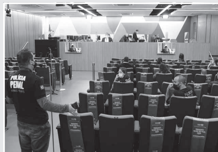
Servidores da segurança relataram que muitas vezes precisam recorrer à Justiça para obter seus direitos