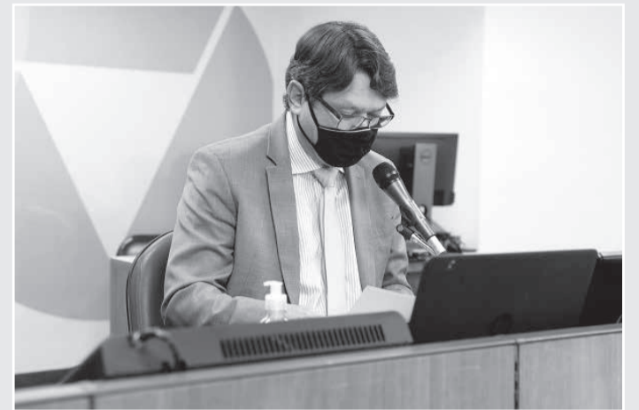
Proposição busca incentivar adoção de áreas esportivas por indústrias e comerciantes

Em seu texto original, o PL 351/19 institui no Estado a campanha "adote uma área esportiva". Ela deverá ser promovida junto às indústrias e aos estabelecimentos comerciais e de