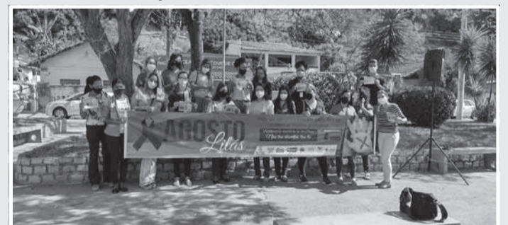
Conscientização sobre a Lei Maria da Penha, Vila São João