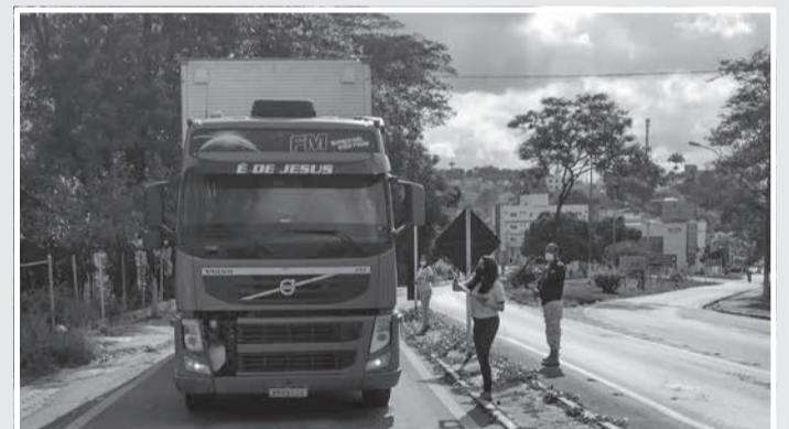
Ações realizadas na BR-116