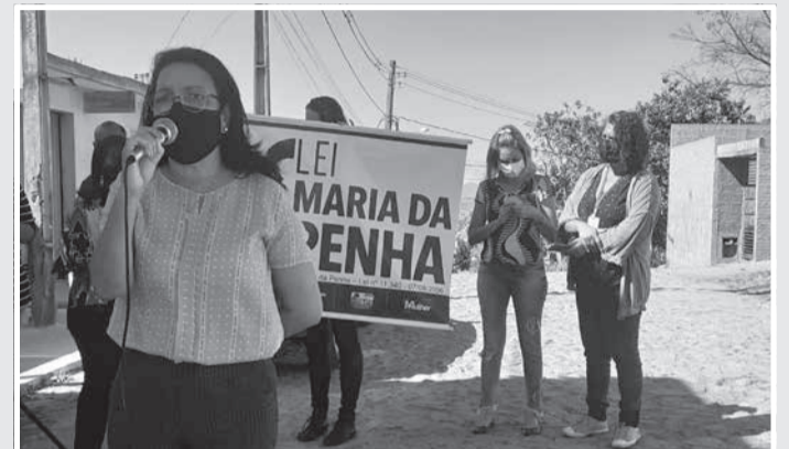
Conscientização sobre a Lei Maria da Penha, no Alto da Bela Vista