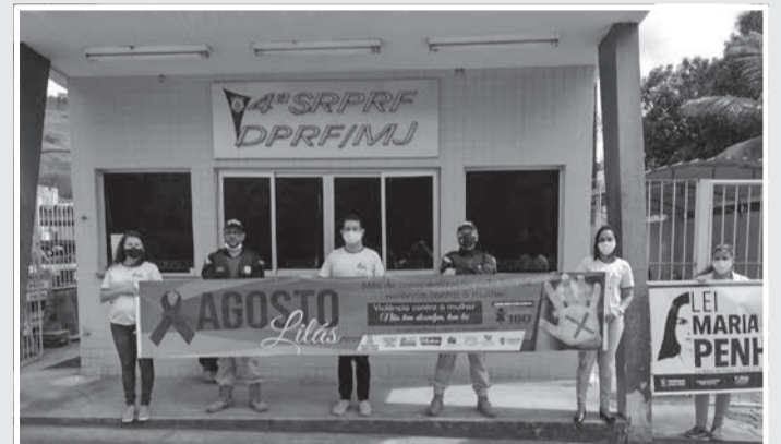
Blitz educativa na BR-116