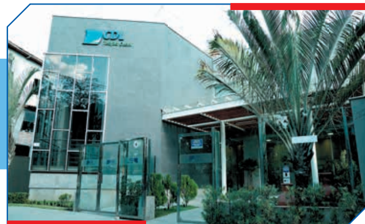
A Câmara de Dirigentes Lojistas de Teófilo Otoni (CDL-TO) passou por amplas reformas nas suas instalações