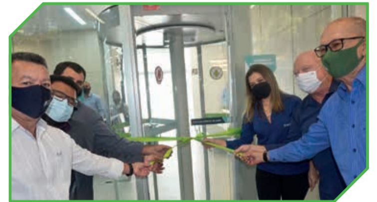
Corte da fita inaugural das novas instalações da agência AC Credi em Teófilo Otoni