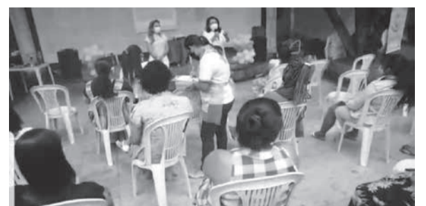
Evento realizado no Casarão do SESC, centro de Teófilo Otoni

Na terça-feira (31/08/21), no encerramento da programação do Agosto Lilás, mês de conscientização pelo fim da violência contra a mulher, a Prefeitura de Teófilo Otoni, por meio da Secretaria Municipal de Ação Social, promoveu palestras e atendimentos para 30 mães e gestantes do município, no projeto “Carinho e Direitos em Dobro”.