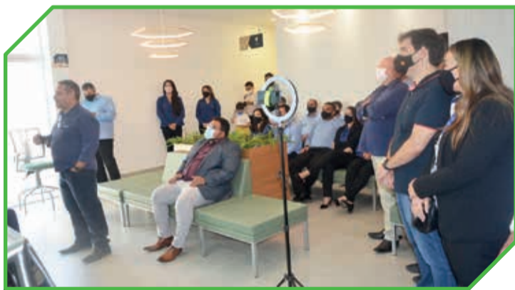
O evento foi transmitido simultaneamente para 12 agências AC Credi