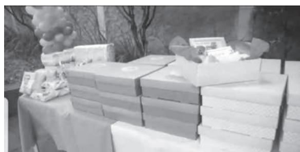
As participantes receberam brindes durante o evento