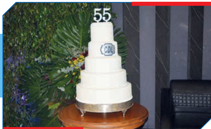
São 55 anos de prestação de serviços de excelência ao empresariado e à sociedade em geral