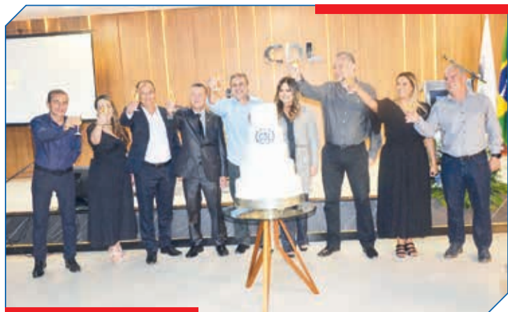
Um brinde aos 55 anos da Câmara de Dirigentes Lojistas de Teófilo Otoni (CDL-TO)