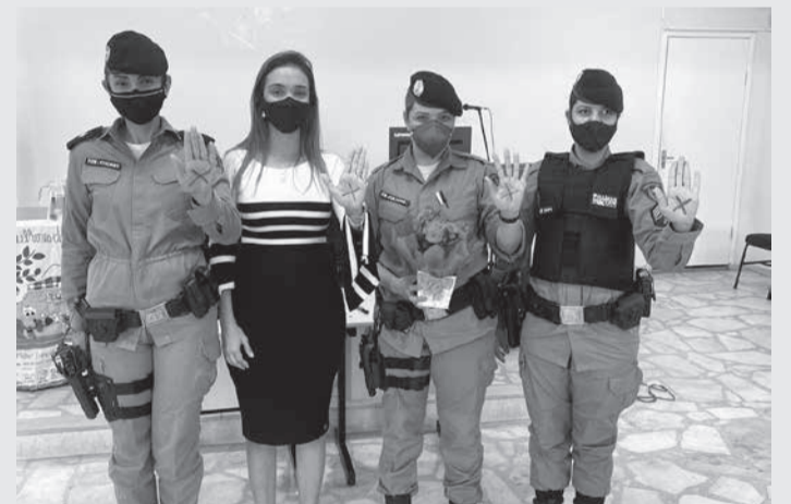
Referência à Campanha Sinal Vermelho do CNJ