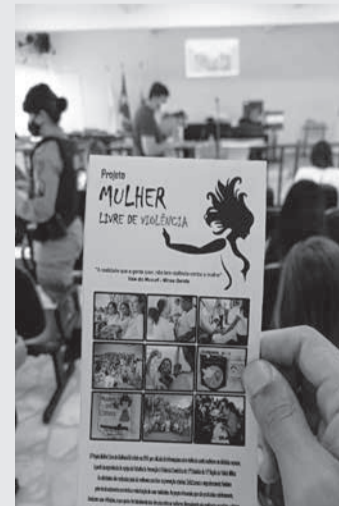
Folder do Projeto Mulher Livre de Violência