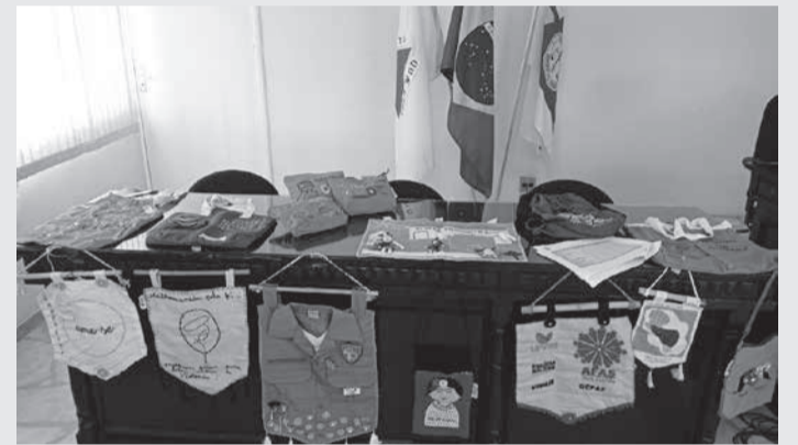
Artesanato das Mulheres do Cedro