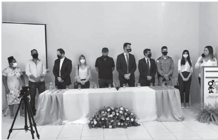
O projeto foi lançado e apresentado em solenidade no último dia 09/09, com a presença das instituições parceiras

Segundo a juíza, o objetivo é que o projeto mude a perspectiva do enfrentamento da violência contra a mulher, numa região onde essa prática está enraizada. Ela explica