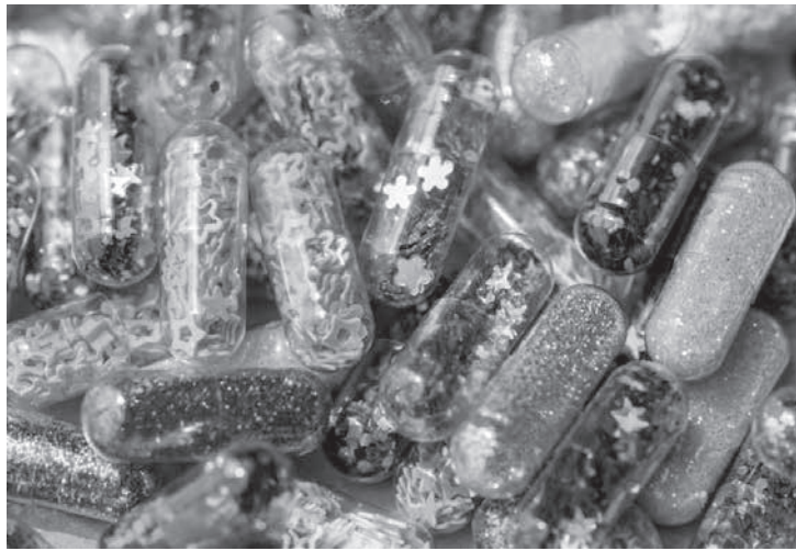
Drogas foram encontradas durante operação para apurar pornografia e satanismo

Diante das investigações, a Justiça Federal expediu ordem judicial de busca e apreensão na casa dele. Na ocasião, foram apreendidos diversos arquivos digitais, além de aparelhos telefônicos, computadores e mídias. À Justiça Estadual foi encaminhada cópia da decisão e laudo pericial para a apuração do delito de tráfico de drogas. A prática dos outros delitos é de competência da Justiça Federal. No local, foram encontrados