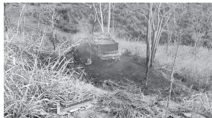
Após a colisão frontal, os dois veículos pegaram fogo

liberados para o Instituto Médico Legal (IML) da região, para necropsia. A ocorrência foi registrada pela Polícia Rodoviária Federal e as causas da tragédia serão apuradas pelas autoridades locais.