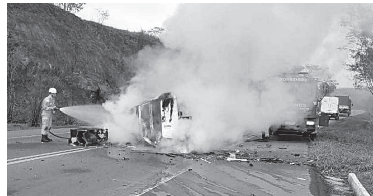
Acidente aconteceu neste domingo (26) próximo ao trevo de Vista Alegre

Bombeiros do 7º Pelotão de Leopoldina utilizaram cerca de quatro mil litros de água para debelar as chamas. Após os trabalhos, os corpos foram retirados das ferragens e