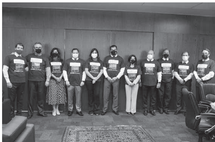
Ações do TJMG pretendem dar visibilidade ao assunto, bem como incentivar a criação de políticas públicas e o mapeamento de casos

A desembargadora explicou ainda que, ao abraçar esse tema, a Coinj e a Comsiv pretendem contribuir para que as autoridades da área de segurança pública invistam, mapeiem e efetivamente atuem para inibir o tráfico de pessoas. A magistrada afirmou que a falta de dados sobre o assunto e a subnotificação dos casos dificultam o enfrentamento