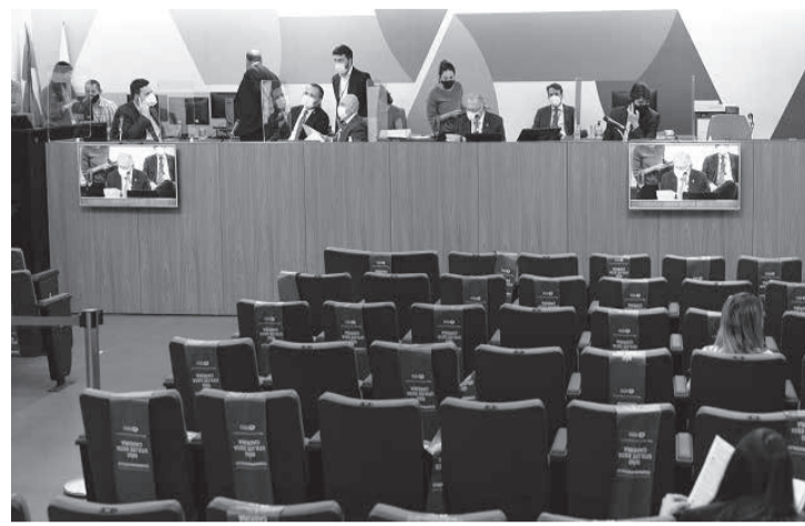
Comissão também analisou projeto sobre convênio para cobrança de IPVA

O substitutivo nº 1 aperfeiçoa o texto sem, contudo, fazer modificações no conteúdo, conforme o parecer. “Consideramos que as medidas propostas pelo projeto em análise fortalecem o Conselho de Contribuintes, concorrem para elevar a eficiência da Administração Fazendária, favorecem o adimplemento das obrigações tributárias dos contribu-