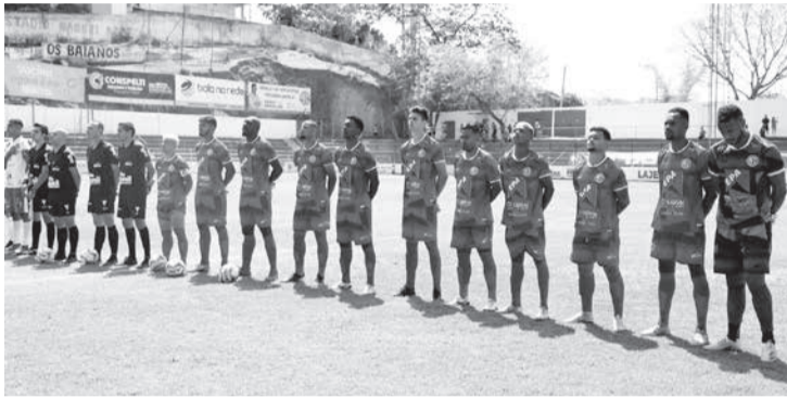
O time do América tem agradado aos torcedores