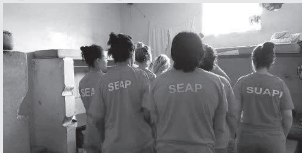
Norma teve origem no PL 5.054/18, aprovado pelo Plenário da ALMG de forma definitiva no último dia 2 de setembro

Proibir o uso de algemas em presas ou internas parturientes. Esse é o objetivo da Lei 23.947, de 2021, cuja sanção feita pelo governador Romeu Zema foi publicada no Diário Oficial do Estado do último sábado (25/9/21). A norma teve origem no Projeto de Lei (PL) 5.054/18, do deputado Jean Freire, aprovado pelo Plenário da Assembleia Legislativa de Minas Gerais (ALMG) de forma definitiva no último dia 2 de setembro.