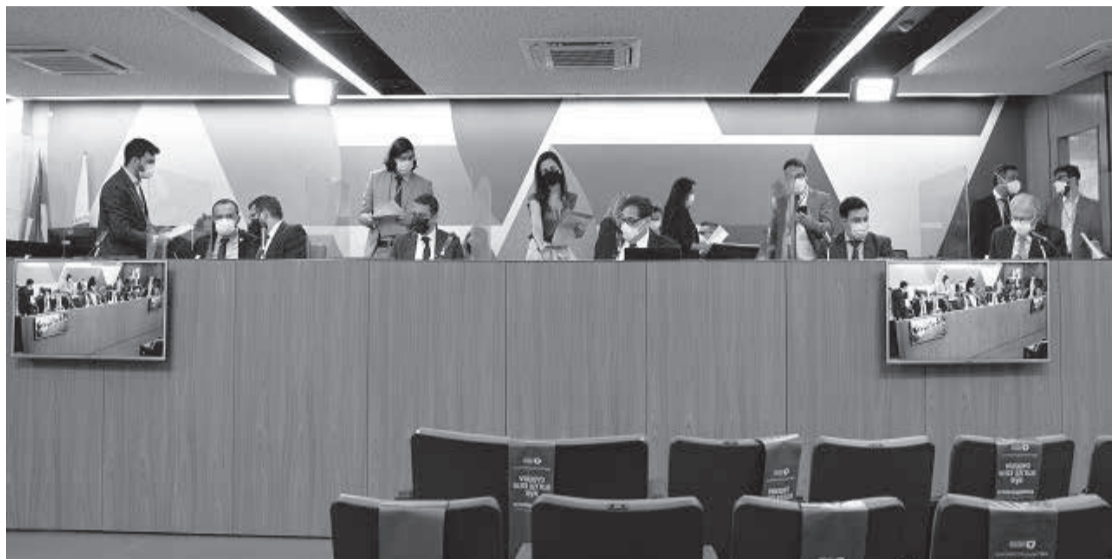
Parlamentares analisaram projeto que regula o uso de assinaturas eletrônicas

Objetivo da matéria é regular atos de pessoas jurídicas e físicas praticados com a administração pública