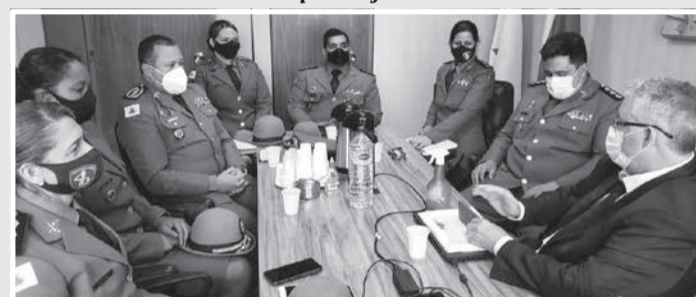
Reunião da comitiva PMMG com o Deputado Sub Ten Gonzaga