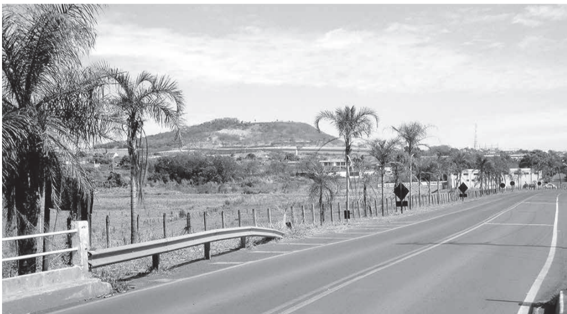
Viagem de Pedro Leopoldo a Sete Lagoas acabou possibilitando ofensas dentro de ônibus (Foto ilustrativa)

Trocador agrediu verbalmente idoso que comprovava direito à gratuidade da viagem