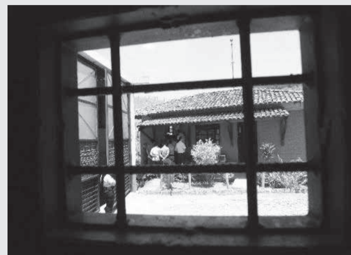
Consequências do fechamento das unidades para a segurança pública do Estado preocupa a comissão

No requerimento para a realização da audiência, o presidente da comissão argumenta que o artigo 103 da Lei Federal 7.210, de 1984, que trata da Lei de Execução Penal, prevê que