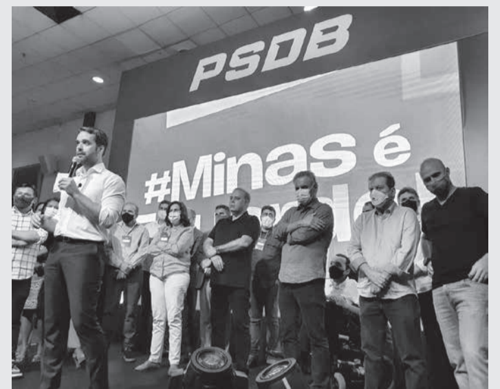
Aécio e lideranças do PSDB de Minas Gerais durante encontro político em Belo Horizonte em que foi formalizado apoio do diretório estadual a Eduardo Leite nas prévias do PSDB

Aécio foi recebido com entusiasmo e alegria no encontro e saudou Eduardo Leite destacando a identidade que existe entre a gestão atual no Rio Grande do Sul e a realizada em Minas Gerais durante os oito anos de seu governo, com a transformação ocorrida no Estado. "Esse conjunto de tucanos que hoje se reúnem em apoio ao seu