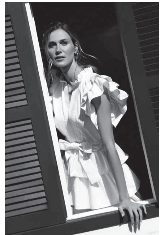
O alto-verão da Lalibela