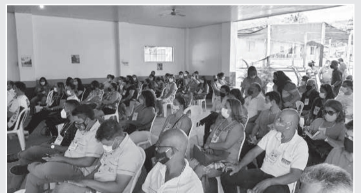
1º Seminário de Turismo de Ataléia