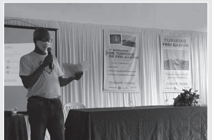
1º Seminário de Turismo de Frei Gaspar

inclusive, já vem sendo exploradas no município por visitantes da região.