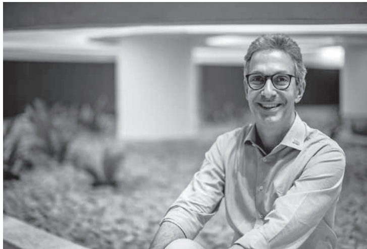
Governador de Minas Gerais, Romeu Zema

Os discursos dos políticos têm sempre o mesmo defeito. Alegam que prefeituras, estados e a própria federação estão sempre com os cofres vazios, por isso quase todos justificam que a falta de verbas, prejudica seus mandatos. Também de forma semelhante os eleitos destroem algumas benfeitorias, fruto dos mandatários anteriores, para depois fazê-las de novo, e ganharem o título da autoria. Esse casamento desencontrado, do discurso com as gestões, vem de longa data, desde quando “amarrava cachorro com linguça”. A estratégia: discurso de políticos com promessas não cumpridas, vem da época em que o transporte era no lombo dos burros, dos carros de bois, caminhões, depois comboios, locomotivas movidas a lenha, depois a diesel, canoas, barcos, depois navios, teco-teco, depois naves gigantescas e helicópteros. O palanque não é mais coberto por lona,