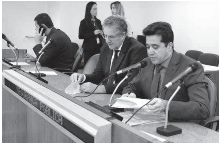
A atividade foi requerida pelo presidente das comissões de Segurança e Especial da PEC 53, deputado Sargento Rodrigues

Atualmente, tramita na ALMG a Proposta de Emenda à Constituição (PEC) 53/20, que ajusta a Constituição Estadual às modificações trazidas pela citada emenda federal. O