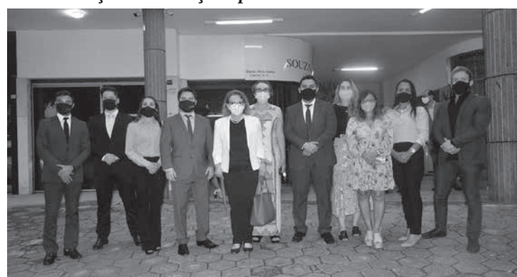
Composição da Chapa Avançar +, Diretoria e Conselho Subseccional

cional, campanhas de vacinação, apoio aos advogados em situação de vulnerabilidade e doença, apoio psicológico e cuidados com a saúde, destacando o atendimento gratuito e online com nutricionista e o projeto Movimento-se que culminou com a Caminhada dos Advogados.