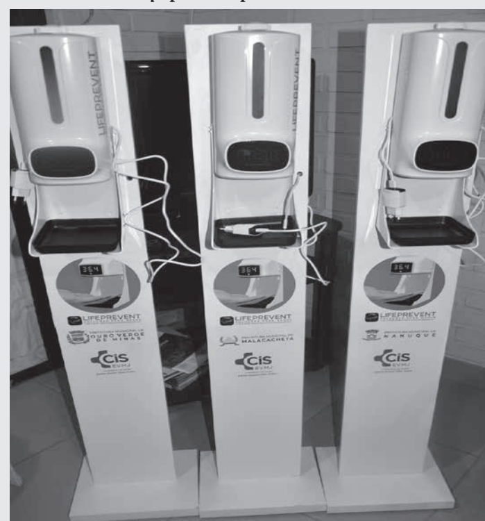
Aparelho com dispenser de álcool em gel e medidor de temperatura corporal eletrônico

atendimento para outras doenças. “E o Consórcio está lá pra isso, para atender essas demandas que estão aumentando a cada dia, atender à população, principalmente, a mais carente”, disse.