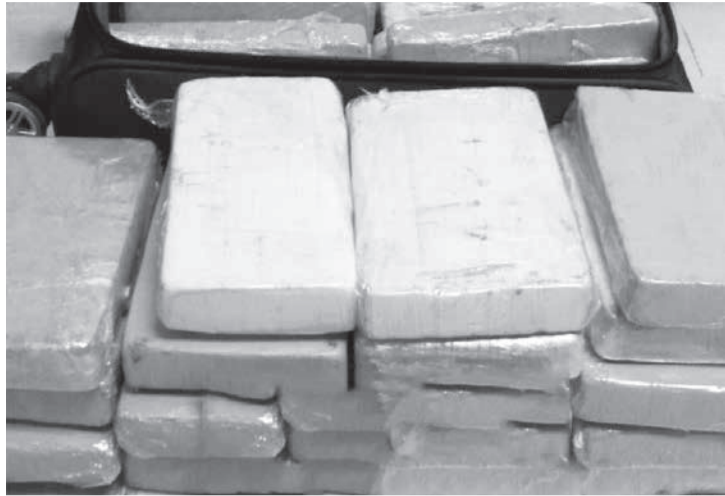
Foram apreendidas drogas fragmentadas em barras e em invólucros, mais 11 pacotes de skank, balanças de precisão e material para embalar os entorpecentes

A Polícia Militar apreendeu na residência do acusado, no Bairro Jardim Felicidade, região Norte da capital, 120kg de maconha, fragmentados em barras e em invólucros, mais 11 pacotes da droga skank, balanças de precisão e material para embalar os entorpecentes. Segundo o juiz Thiago Colnago, as consequências da transgressão são graves, "haja vista que a quantidade excessiva de entorpecentes, ao ser lançada no mercado de consumo, atingiria número considerável de pessoas", disse.