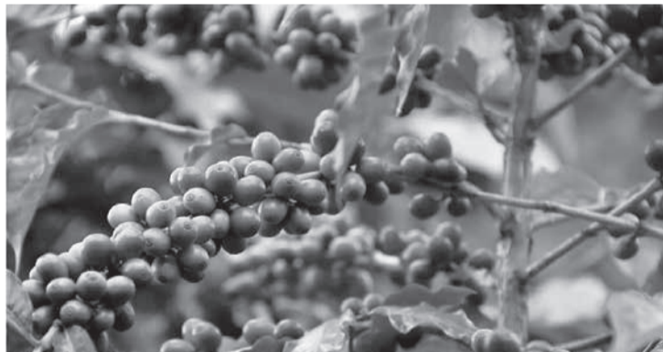
Acidente com criança ocorreu durante processo de beneficiamento de café (Foto ilustrativa)

tes da Silva Filho entendeu que, no caso, era aplicável a teoria do risco. Segundo essa proposta, aquele que pratica atividade perigosa e lucrativa deve arcar com as consequências prejudiciais que dela decorrerem, sem necessidade de a vítima demonstrar se houve dolo ou culpa. Diante disso, o magistrado considerou que não era pertinente avaliar se os pais falharam ou não no dever de vigilância, pois a responsabilidade do dono da propriedade rural, do operador da máquina e do proprietário das sacas era objetiva.