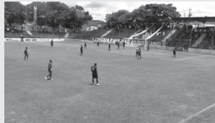
O América venceu o Manchester por 1 X 0 no Nassri Mattar