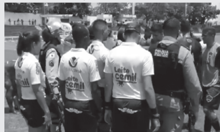
Polícia Militar dando apoio em campo

Mas, já encerrando o jogo, o clima esquentou dentro de campo. Praticamente no último lance do jogo, o goleiro Robert disputou a bola, e o jogador do Manchester desabou no chão, e o juiz marcou pênalti em favor do Manchester. E o goleiro Robert ainda recebeu cartão amarelo, por discordar das decisões da arbitragem. Jogadores e diretoria do América ficaram revoltados. Depois de muita confusão em campo, o juiz anulou o pênalti, e começou outro tumulto, dessa vez, a equipe do Manchester partiu pra cima da arbitragem, com reclamações. A Polícia Militar teve que entrar no gramado e intervir na