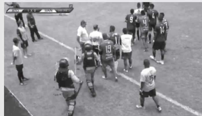
Confusão quando foi marcado o pênalti em favor do Manchester