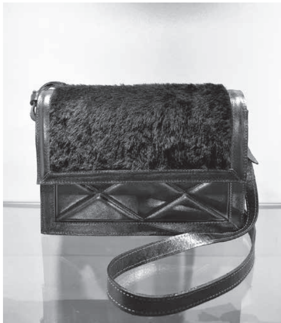
A bolsa em pele & pelo de Cellso Afonso