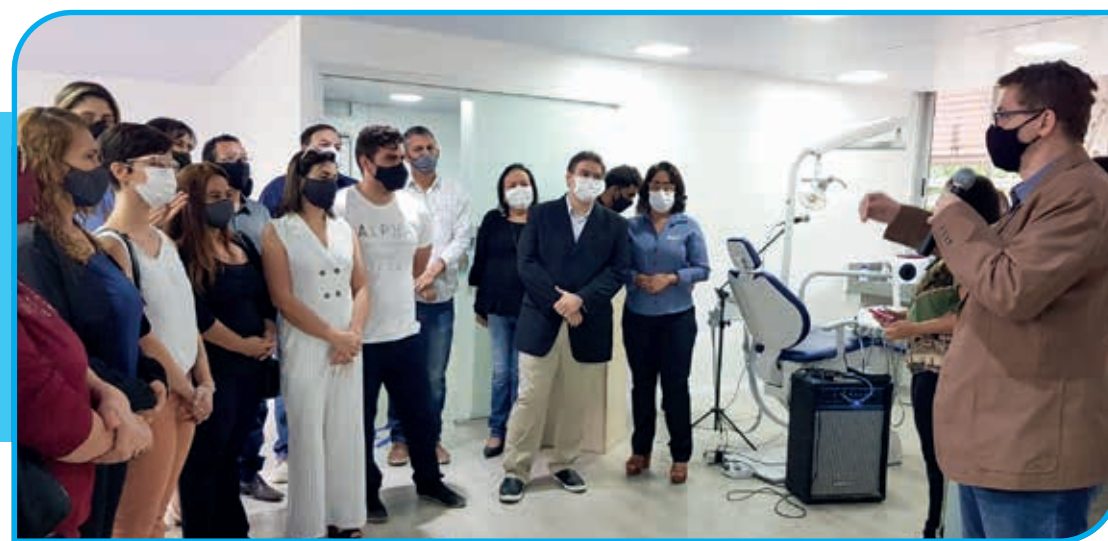
Centro Universitário Doctum tem o melhor quadro docente de odontologia da região

O Centro Universitário Doctum de Teófilo Otoni (UniDoctum) inaugurou na manhã de sábado (23/10/2021), a Clínica Odontológica no Campus São Jacinto, com 15 consultórios individuais, para atender à população carente da cidade e região. Um ambiente amplo, climatizado, a clínica escola oferece todo o conforto aos estudantes que vão desempenhar suas aulas práticas, orientados e acompanhados por professores altamente capacitados, e às pessoas que