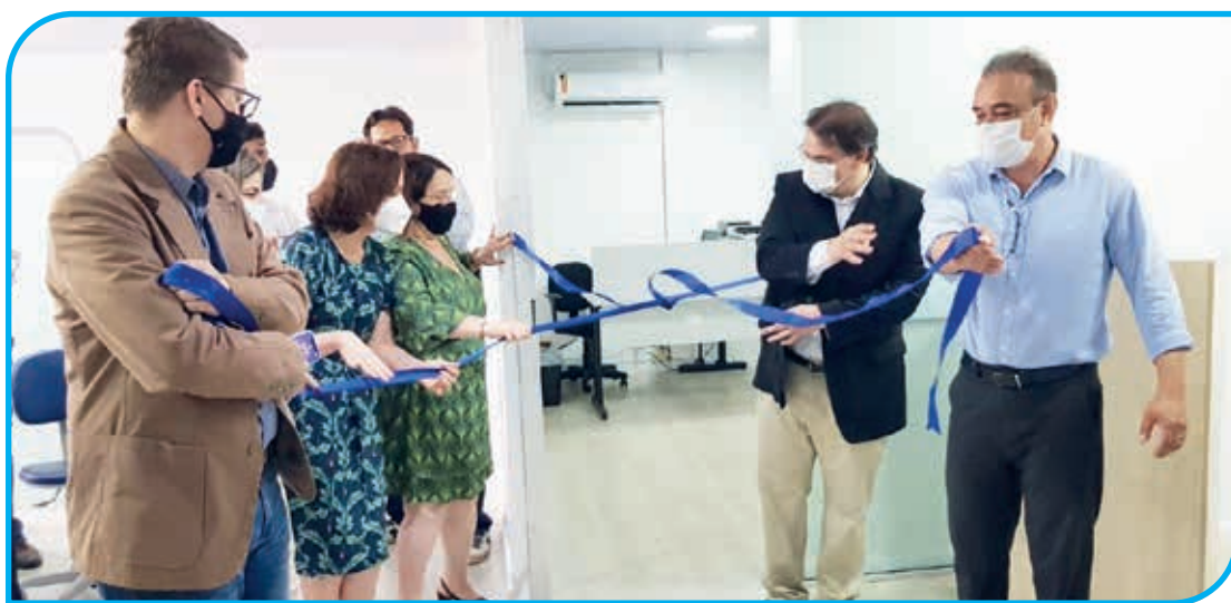
Momento do corte da fita inaugural da clínica odontológica na Doctum Teófilo Otoni