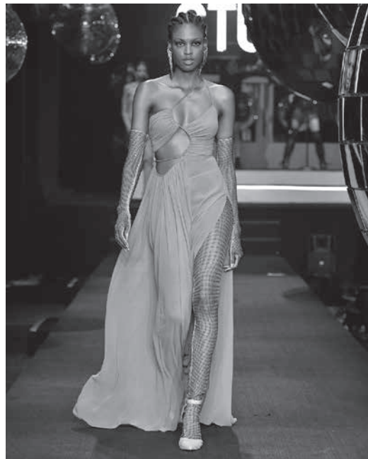
Desfile da Skazi