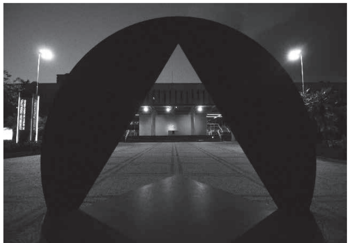
O Novembro Azul é uma homenagem ao Dia Mundial da Pneumonia

Rua Pastor Hollerbach, 218 A • Grão Pará (33) 3522-3471 • (33) 98750-1641 • (33) 98750-1644 | Teófilo Otoni/MG