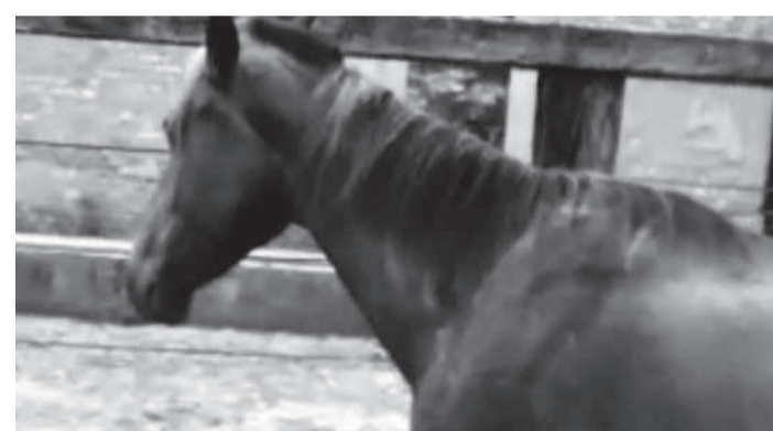
A Polícia Civil conseguiu localizar um cavalo furtado e restituiu à vítima, fazendeiro da região de Teófilo Otoni