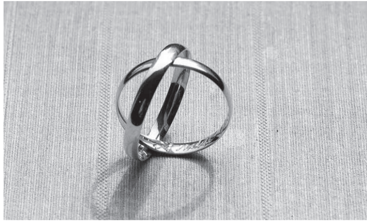
Com o mutirão, todos que já vivem juntos e desejam regularizar a situação poderão se casar, com menos burocracia e sem custo financeiro

Para a inscrição, é preciso também apresentar documento de identidade e CPF dos cônjuges, comprovante de residência, certidão de nascimento dos filhos, caso os interessados os tenham, e comprovante de renda. Os solteiros devem levar certidão de nascimento; e os divorciados, certidão de casamento com divórcio averbado - ambos documentos devem ser