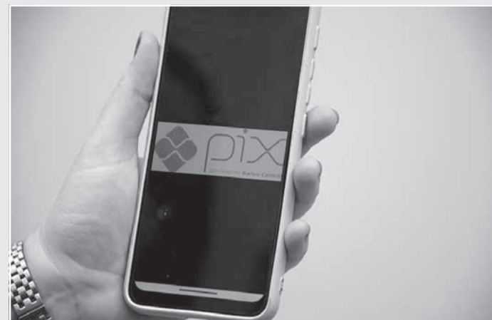
Pix pode ser usado para a arrecadação de receitas do FEPJ desde o início desta semana

Diante de tudo isso, o TJMG não poderia deixar de incorporar essa facilidade para os jurisdicionados. Nesse sentido, foram feitos esforços internos para adequações de soluções