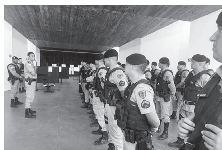
Participaram do curso 29 militares de Nanuque, Almenara, Teófilo Otoni e Araçuaí

O tenente-coronel Marinho exaltou a importância do curso GEPAR, sob os pilares da prevenção mobilização social e repressão qualificada, destacando a