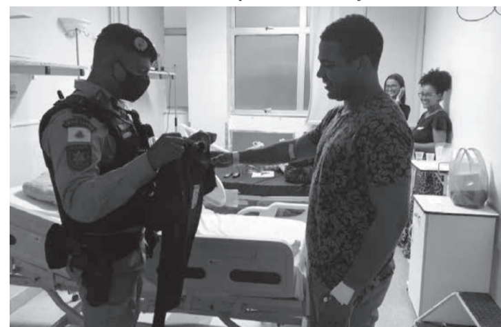
Por um problema de saúde, o militar não concluiu o curso, mas recebeu uma homenagem