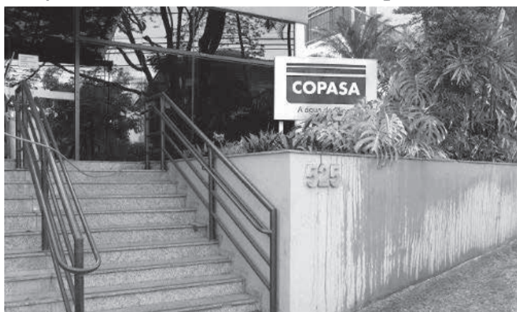
A situação da Copasa e de seus trabalhadores foi tema de audiência nesta quarta (17)

dos relatos de contratações irregulares de supostos parentes do governador Romeu Zema e de casos graves de assédio dentro da empresa. Ainda está previsto um ato em frente à Assembleia contra a declarada intenção