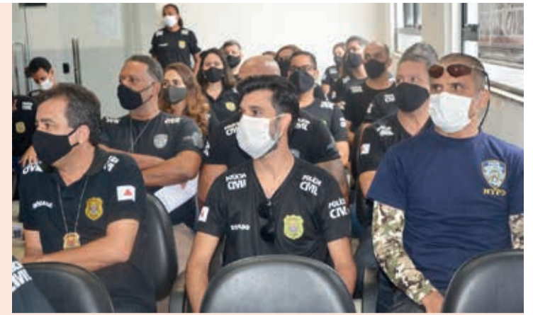
No treinamento foram repassadas técnicas e formas de abordagem a um agressor armado com faca