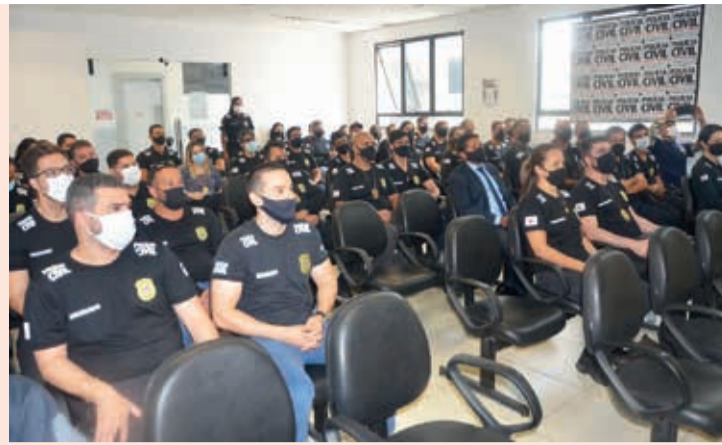
Participaram policiais de todo o 15º departamento: Teófilo Otoni, Nanuque, Almenara e Pedra Azul