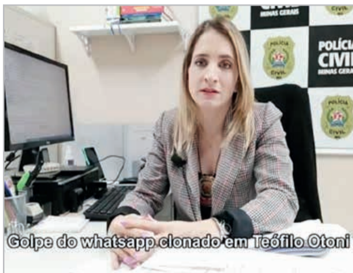
Golpe do whatsapp clonado em Teófilo Otoni