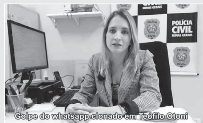
Golpe do whatsapp clonado em Teófilo Otoni

Quando a vítima envia o código, automaticamente ela estará ativando o seu whatsapp em outro aparelho. O seu celular fica bloqueado e o estelionatário consegue ativar e usar o whatsapp em outro aparelho. A partir daí os golpistas conseguem fazer diversas coisas, por exemplo, pedir dinheiro emprestado aos contatos se passando pela vítima. “O alerta da Polícia Civil hoje é cuidado com as redes sociais de vocês, inclusive, uma forma que garante certa segurança, é realizar a verificação