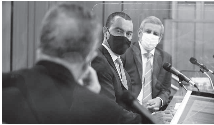
Delegado-chefe do Departamento Estadual de Investigação de Crimes contra o Patrimônio garantiu que investigações estão avançadas