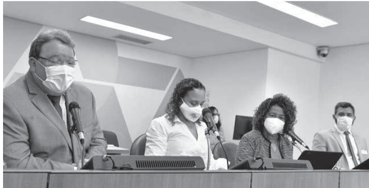
Deputados pediram por ações efetivas dos governos estadual e federal, para reduzir os casos de violência doméstica em Minas

Regulamentação do banco de empregos para vítimas de violência também foi demanda apresentada em audiência