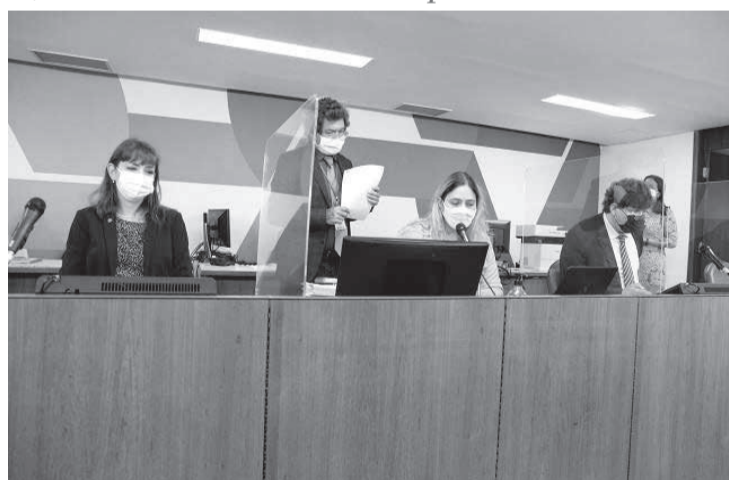
Comissão de Educação reivindica a distribuição dos recursos do Fundeb prevista em emenda constitucional

Segundo a Emenda Constitucional 108, de 2020, 70% do Fundeb serão destinados à remuneração dos profissionais da educação básica. Estão incluídos nessa categoria os professores e todos os profissionais que oferecem suporte pedagógico direto ao exercício da docência. São os servidores que atuam em cargos de direção ou administração escolar, planejamento, inspeção, supervisão,