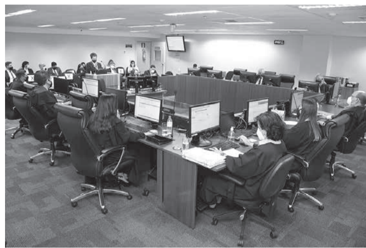
Na sessão ordinária desta quinta-feira (25/11), foram julgados 236 processos