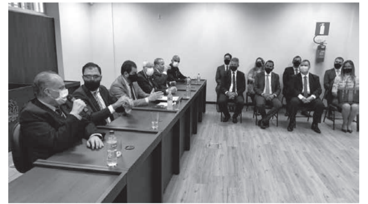
O vice-presidente do TJMG, desembargador Newton Teixeira Carvalho, destacou que o novo fórum abriga com mais conforto o Cejusc da comarca

O juiz Rafael Continentino afirmou ainda que, especialmente no contexto econômico, político e social pelo qual o mundo está passando, é preciso empenhar-se de forma redobrada para sempre oferecer uma prestação jurisdicional de qualidade,