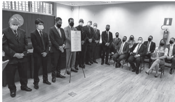
Entrega do prédio do fórum Dr. Leonardo Antônio Pimenta representa nova e promissora fase do Poder Judiciário na Comarca de Capelinha

de realizações em curso ou concluídas do Programa Justiça Eficiente (Projef), tais como a digitalização e a virtualização de 100% dos feitos cíveis, a implantação do Processo Judicial eletrônico criminal, a instalação de Cejuscs em todas as 297 comarcas, a melhoria das edificações e o investimento em tecnologia, pessoal e na eficiência e ética da administração. "O acesso à Justiça é um direito fundamental do ser humano, sendo imprescindível para o combate à desigualdade, para o fortalecimento da democracia e da cidadania e para a almejada paz social", concluiu.