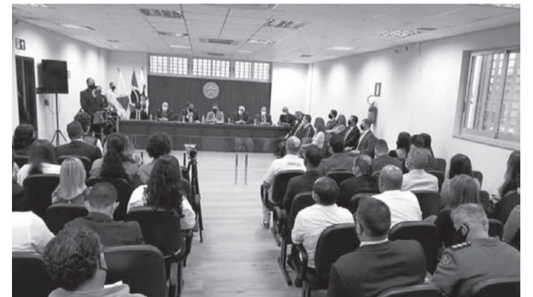
Espaço atenderá em torno de 60 mil habitantes, residentes na sede (Capelinha) nos municípios de Água Boa e Angelândia e no distrito de Palmeira de Resplendor

que impacta positivamente a vida das pessoas e promove a paz. Ele também expressou sua esperança de que a dura e difícil etapa atual em breve se amenize. "Nada mais digno e democrático do que acolher o cidadão, com respeito e consideração, como nos impõe a Constituição Federal de 1988. Estes, embora tragam angústias, frustrações e sofrimentos, não obstante vêm esperançosos de que receberão justa e devida tutela jurisdicional aos seus direitos. E é exatamente isso que nos motiva e nos move: saber da esperança e da confiança do cidadão na Justiça e no Poder Judiciário. Esta é a mesma esperança que jamais podemos deixar que se apague", concluiu.