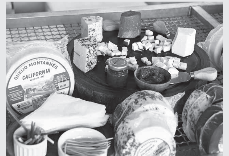
A feira comercializa doces, quitandas, hortigranjeiros, queijos e artesanatos

O vice-presidente da Assembleia, deputado Antonio Carlos Arantes, também comemorou o retorno do evento. “O principal é a distribuição de renda que isso representa, mas, também, é alegria, confraternização, saúde e turismo”, exaltou. A feira contou com a participação de produtores de 20 municípios, em 27 estandes. Foram comercializados doces, quitandas, hortigranjeiros, queijos e artesanatos.