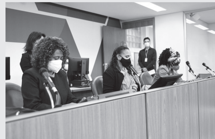
Trabalho da Procuradoria vai se juntar ao da Comissão de Defesa dos Direitos da Mulher

O acesso à Procuradoria poderá ser feito pelo Portal da ALMG, na página da Procuradoria da Mulher ou pelo Fale com a Assembleia. Inicialmente, não haverá um número de telefone disponível para esse canal. Nestes espaços, as pessoas interessadas encontrarão informações sobre o órgão e um formulário para envio de solicitações de atendimento. As demandas serão recebidas e analisadas pela Procuradoria da Mulher, que poderá encaminhar a solicitação à Defensoria Pública ou a outro órgão competente, com o acompanha-