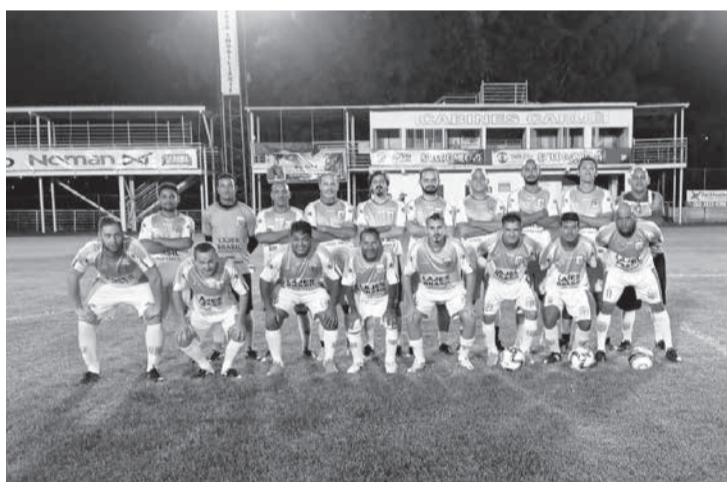
Concórdia Atlético Clube – Masters