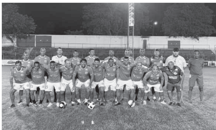
América Futebol Clube – Masters