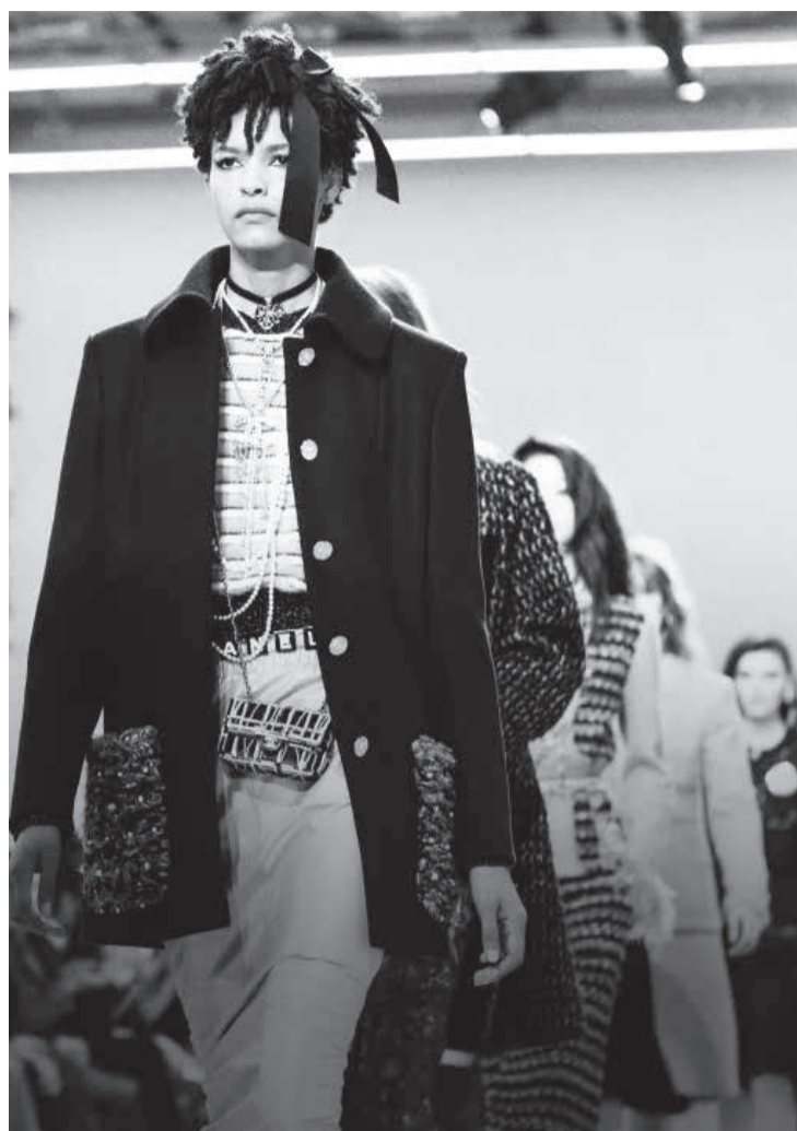
Desfile-abertura do LM19 da Chanel

Pois esse ouro brilhante está sendo perdido. E bastaria uma iniciativa dessas para preservar os