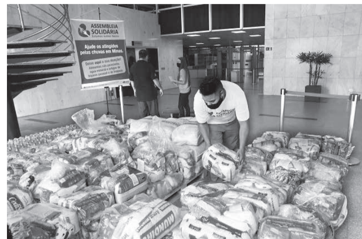
As doações podem ser entregues no posto de arrecadação do programa Assembleia Solidária no Palácio da Inconfidência

Assembleia Solidária - Criado em setembro de 2011 pela Assembleia e por entidades parceiras, o programa Assembleia Solidária mobiliza cidadãos, entidades e instituições públicas e privadas em