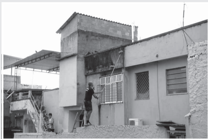
A Cemig orienta que os serviços de obras civis devem sempre serem feitos com o máximo cuidado e segurança, observando a distância de segurança da rede elétrica e o uso de EPIs

“A utilização de equipamentos de proteção individuais e coletivos é fundamental para impedir a queda de nível nos trabalhos em altura também são