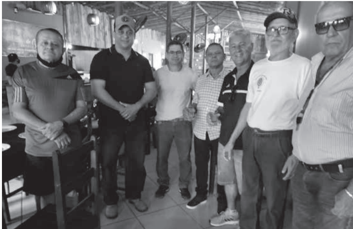
Os ex-atiradores se reuniram com seus familiares e amigos durante um churrasco de confraternização